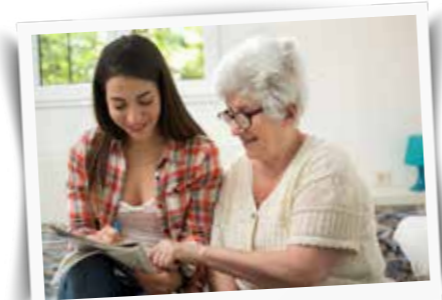
Denksport ist zeitlos – Rätseln macht Jung und Alt schlauer!

Logikrätsel und Denksportaufgaben sind wahre Fitnessübungen für den Kopf. Sie zeigen Ihnen, wie man Probleme systematisch angeht, Muster erkennt und Lösungen entwickelt. Und wussten Sie, dass Rätsellösen auch entspannend wirken kann? Es lenkt Ihren Geist auf eine positive, interessante Aufgabe, hilft Ihnen, Stress abzubauen und für einen Moment abzuschalten.