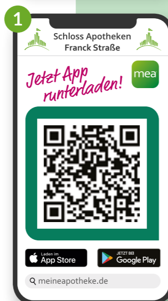
Schloss Apotheke Franck Straße

Hinweis: Sie haben ein iPhone? Dann scannen Sie nach der Installation der mea® App erneut den QR-Code Ihrer Stammapotheke, um diese als Lieblingsapotheke hinzuzufügen.