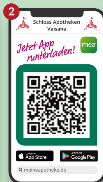
Schloss Apotheke Vaisana

Sie sparen Zeit und doppelte Wege, indem Sie mit der App Ihre Produkte, Medikamente und Rezepte vorbestellen und nur noch zum Abholen in die Apotheke kommen oder diese mit unserem Botendienst nach Hause zugestellt bekommen.